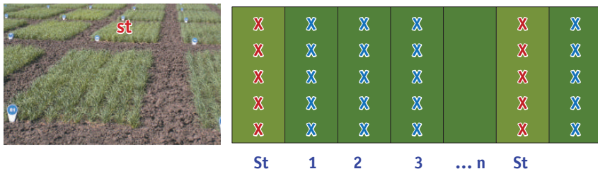
Рис. 1. Розміщення ділянок контрольної і стандартної проб st – стандартна проба ; 1... n – контрольна проба

Фіксування показників у середині одного сорту полегшується, якщо відповідні партії насіння від одного виробника насіння висівають на сусідніх ділянках. У такий спосіб можна легко виявити наявність домішок на одній ділянці чи іншій. Для забезпечення достовірності результатів досліджень на контрольній і стандартній ділянках пріоритетним є мінімальна кількість рослин на ділянці. Залежно від кількості контрольних проб приймається рішення щодо кількості та розміщення ділянок стандартної проби. Зазвичай на 1-10 контрольних проб використовують 1 стандартну пробу. Приклад розміщення ділянок ділянкового (ґрунтового) сортового контролю показано на рис. 1.