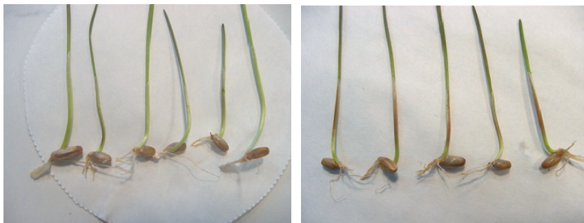
Рис. 2. Проросле насіння: наявність або відсутність антоціанової пігментації в колеоптилі жита посівного ( Secale cereale L.)