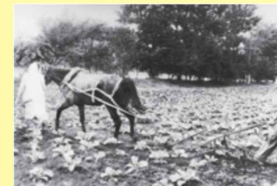
Догляд за рослинами на дослідних ділянках